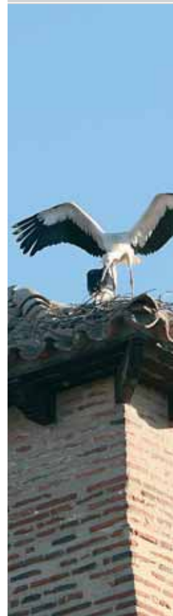
Einer der vielen Störche im Städtchen Toro

19+/20 • 2011 bis 2022 • Art. 240022 • 75cl Fr. 55.-