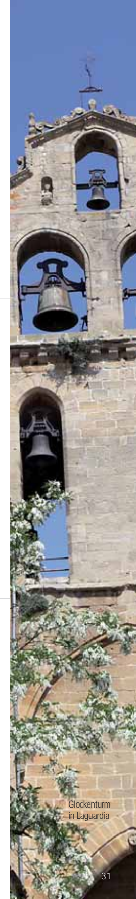
Glockenturm in Laguardia

18/20 • 2011 bis 2018 • Art. 238206 75cl Fr. 22.50 (ab 26.9.2011 25.-)