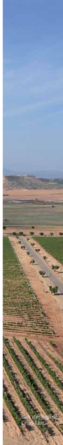
Blick vom Pago de Cirsus-Turm.

150cl Fr. 38.- (ab 26.9.11 Fr. 55.-) • Art. 240597 300cl Fr. 81.- (ab 26.9.11 Fr. 120.-) • Art. 239405 (Jahrgang 2006) 600cl Fr. 195.- (ab 26.9.11 Fr. 288.-) • Art. 240598 900cl Fr. 269.- (ab 26.9.11 Fr. 392.-) • Art. 240599