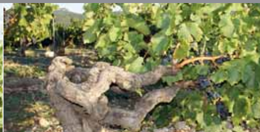
Unglaublich: Bis zu 100jährige Rebstöcke.