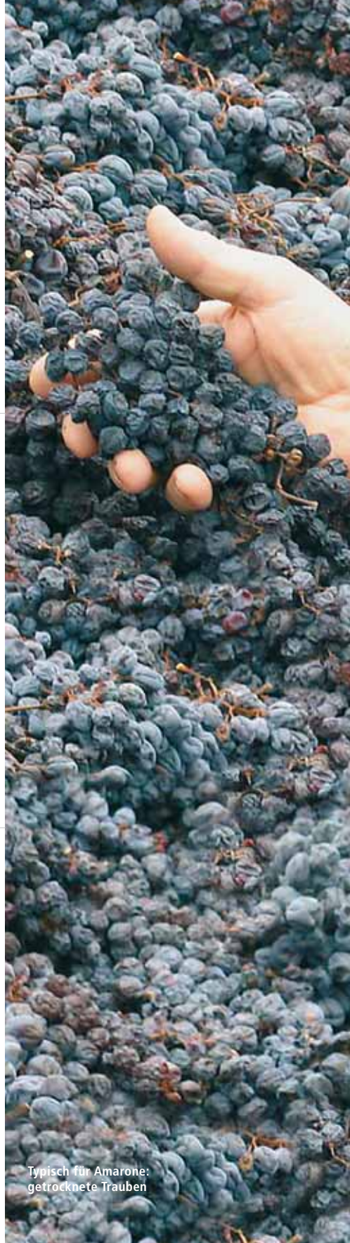
Typisch für Amarone: getrocknete Trauben